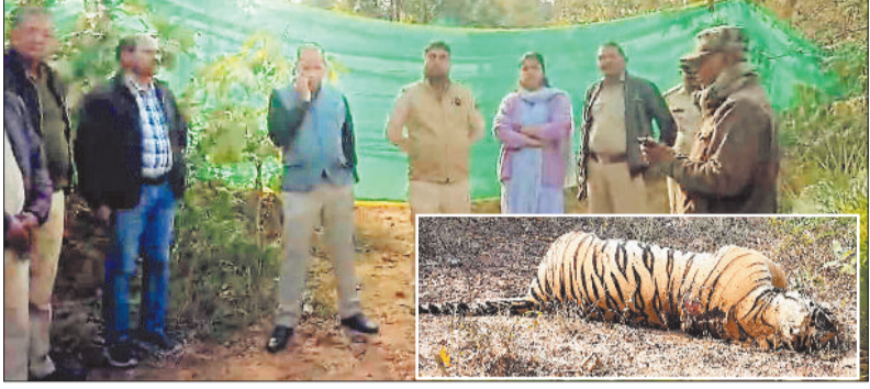
घटना स्थल पर मौजूद वन अधिकारी, इनसेट में मृत बाघ।

खास बात घटनास्थल के पास ही है टाइगर रिजर्व का जंगल