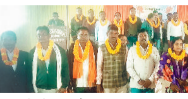
हरिभूमि न्यूज, बैकुण्ठपुर