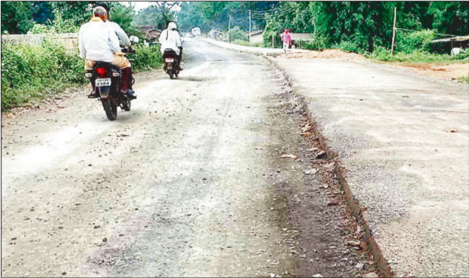
निर्माणाधीन आधी-अधूरी सड़क।

प्रतापपुर-राजपुर के बीच लोक निर्माण विभाग द्वारा की स्वीकृति के बाद से ठेकेदार द्वारा करोड़ों की लागत से टूट लाने सड़क निर्माण कराया जा रहा है। 84 करोड़ की लागत से बन रही सड़क निर्माण बड़े ठेकेदार द्वारा कराया जा रहा है। 28 किलोमीटर की सड़क निर्माण शुरू हुए पांच साल होने को बावजूद इसके आज तक पूर्ण नहीं सकी। भाजपा मंडल अध्यक्ष