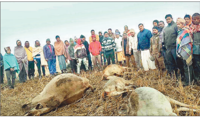
घटना स्थल पर ग्रामीणों की भीड़ व मृत मवेशी।

बतौली क्षेत्र के ग्राम बिलासपुर में आज तड़के मवेशियों से भरा पिकअप अनियमित होकर सड़क किनारे पलटा गई। दुर्घटना में पिकअप में भरे 9 मवेशियों में से चार मवेशी की मौके पर ही मौत हो गई। घटना के बाद मवेशी तस्कर मौके से फरार हो गए। इधर घटना की जानकारी लगने पर हिन्दू संगठन गावों को वाहन से बाहर निकाल सेवा में लगे रहे तथा पुलिस की उदासीन रवैया को लेकर भारी आक्रोशित हैं। जिले में गौ तस्करी नई बात नहीं है कई वर्षों से लगातार तस्कर अंबिकापुर बतौली बगीचा मार्ग से होते हुए पिकअप में मवेशियों को दूध दूध कर कर अंतर्राज्यीय तस्करी कर पुलिस प्रशासन के नाक के पशु क्रूरता