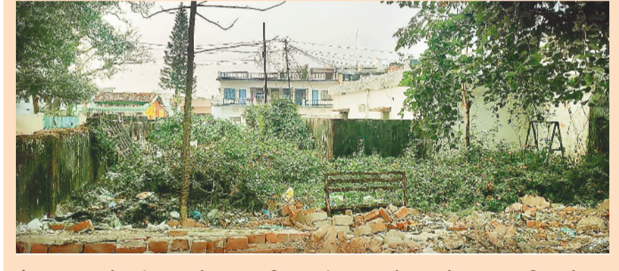
बैकुण्ठपुर। शहर के वार्ड क्रमांक 5 में बनाया गया चिल्ड्रन पार्क रख-रखाव के अभाव में अब अपना अस्तित्व खो चुका है। यह स्थल कभी बच्चों के मुस्कान का केन्द्र रहा वह आज झाड़ियों का जंगल बन गया।